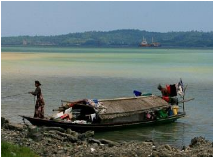
Una dona bajau amarra la casa flotant. Les cases flotants dels bjaus són fetes de vegetals trenats i se sustenten sobre embarcacions bastant petites. Aquesta forma de viure està sent substituïda per habitatges fixos, ja siguin palafits o a terra.

Al segle xx, la gent bajau va començar a construir palafits, cases sobre l'aigua fixes, damunt d'estaques de fusta, al voltant d'establiments comercials xinesos que els compraven els cogombres de mar i altres productes marins.