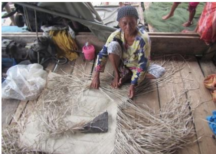
Dona sama-bajau teixint a casa seva, a Labuan Haji, Semporna, Malàisia. (Erik Abrahamsson, Wikimedia Commons)

https://commons.wikimedia.org/wiki/File:Bajau_Laut_Pictures_6.jpg