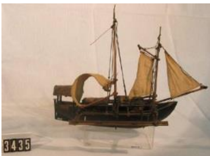
Model del parao (embarcació tradicional emprada arreu de les Filipines) Carmensita. Segle xix. NR 3435

https://commons.wikimedia.org/wiki/File:Sama_woman_making_a_traditional_mat.JPG