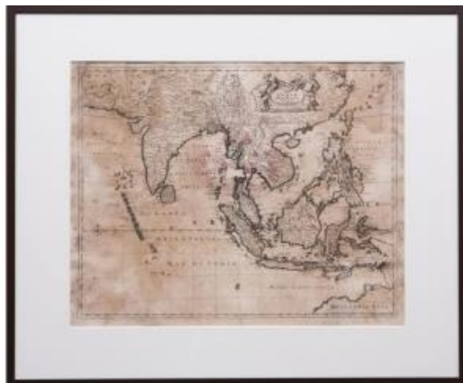
Mapa de l'Extrem Orient: Tabula Indiae Orientalis Emendata a F. de Wit, carta nàutica del sud-est asiàtic, gravada per Jan Lhuillier i impresa a Amsterdam per Frederik de Wit el 1662. Els bjaus s'escampaven per la major part d'aquesta àrea i van establir rutes comercials entre la Xina i Austràlia abans que aquesta darrera fos descoberta pels europeus.