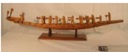
Model de piragua de guerra filipina amb tripulants. NR 1120