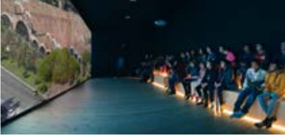
Audiovisuel sur l'histoire du bâtiment des Drassanes Reials.

Exposition autour de l'histoire de l'ensemble monumental des Chantiers Royaux de Barcelona construits pour l'industrie navale catalane pour favoriser l'expansion dans la Méditerranée durant les XIII-XVème siècles. Un parcours à travers l'édifice, les métiers traditionnels et les galères, et en spécial, la réplique de la Galère Royale.