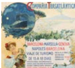
Affiche publicitaire de la Compañía Transatlántica (Ruiz, 1910).