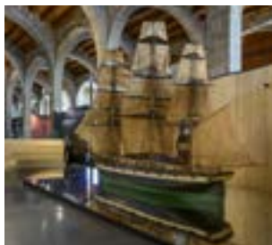
Frégate Barcelona. Modèle d'apprentissage (École de Nautique de Barcelone, XIXème siècle).