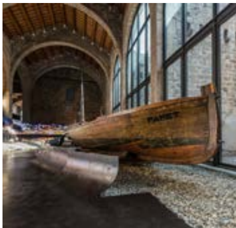
Barque de pêche Papet (XX ème siècle), héritières de la tradition constructive médiévale.