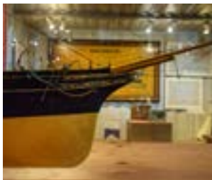
Modèle du bateau à vapeur City of Paris (1888). La transition de la voile à la vapeur et du bois à l'acier.