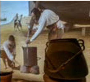
Les métiers traditionnels de la mer.