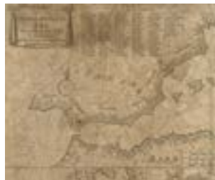
Cartographie de Pieter Goos (Amsterdam, 1673).