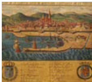
Barcelona avant le développement du commerce avec l'Amérique (XVIIème siècle).

Exposition qui explique l'évolution du commerce par la Méditerranée au commerce transatlantique, ainsi que le passage de la navigation à voile à la navigation à vapeur. Trois siècles où la marine catalane s'ouvre économiquement et socialement à des nouveaux mondes.