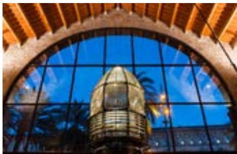
Optique du Phare de Sant Sebastià

L'ensemble monumental des Chantiers Royaux de Barcelona a plus de sept siècles d'histoire. Il a été construit au XIII ème siècle pour la fabrication et maintenance de galères et bateaux de guerre au service du roi d'Aragon Pere el Gran. C'est l'un des bâtiments de style gothique civil les plus emblématiques au monde.