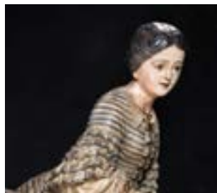
Figure de proue La Blanca Aurora (Lloret de Mar, 1848).