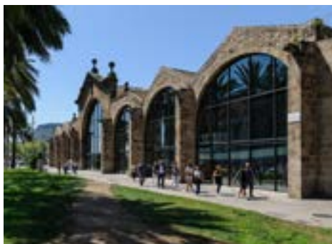
Façade des Chantiers Royaux

C'est un voilier de plus de cent ans qui fait partie du patrimoine de l'eau du Musée, et qui permet de comprendre l'histoire de la navigation et du commerce maritime de notre pays. Pour sa valeur patrimoniale et historique, l'an 2011 il a été déclaré Bien Culturel d'Intérêt National. La Santa Eulàlia est amarrée au Moll de Bosch i Alsina, très près du Musée Maritime. On peut la visiter tous les jours. Les samedis matin elle sort naviguer devant le front maritime de Barcelona, sauf quand elle participe dans des événements nautiques traditionnels.