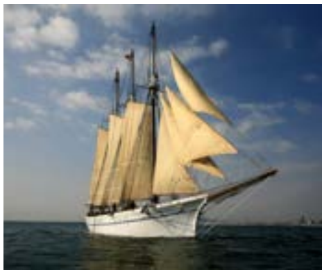
Goélette Santa Eulàlia

Le Musée Maritime de Barcelona (MMB), créé en 1936, est une institution publique consacrée à la divulgation de la culture maritime et, spécialement, à la conservation, préservation et diffusion du patrimoine culturel maritime de la Catalogne. L'MMB est très enraciné dans la ville de Barcelona, tant par sa propre histoire comme par l'édifice qui l'accueille, l'ensemble monumental des Chantiers Royaux de Barcelona.