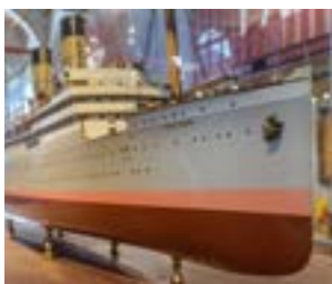
Modèle du bateau à vapeur Royal Edward (Glasgow, 1907).