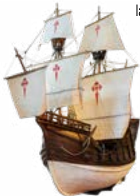
Modèle du Vaisseau Santa Maria de la Victoria (XVIème siècle). Il a été le premier à compléter le tour du monde.

Sept histoires expliquées par sept personnages à bord de sept bateaux qui expliquent des questions universelles comme la découverte de nouveaux territoires, la mer comme un espace de loisir, la vie à bord d'un transatlantique, la mer comme cadre de conflits, la marchandise, la piraterie et la guerre de Course, et le changement technologique. Un voyage par l'histoire de la navigation moderne et contemporaine.