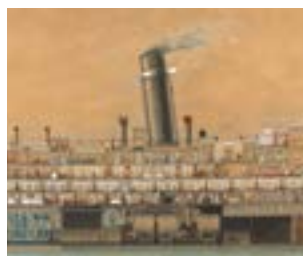
Dessin longitudinal du Reina Victoria Eugènia . Cia Trasatlantique Espagnole. (1912).