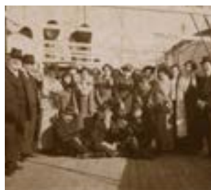
Portrait d'un groupe de passagers sur le pont d'un transatlantique (1910).