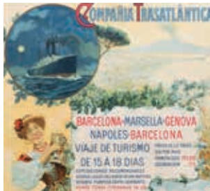
Cartel publicitario de la Compañía Trasatlántica (Ruiz, 1910).