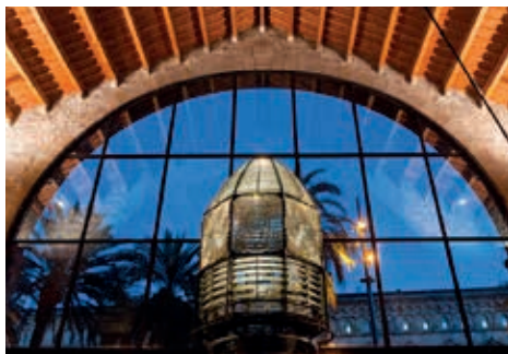
Óptica del Faro de Sant Sebastià

El conjunto monumental de las Reales Atarazanas de Barcelona tiene más de siete siglos de historia. Fue edificado en el siglo XIII para la construcción y el mantenimiento de galeras y barcos de guerra al servicio del rey de Aragón Pere el Gran. Es uno de los edificios representativos del gótico civil más importantes del mundo.