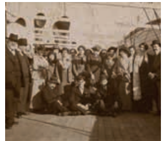
Retrato de un grupo de pasajeros en la cubierta de un transatlántico (1910).