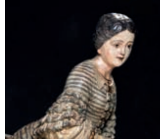
Mascarón de proa La Blanca Aurora (Lloret de Mar, 1848).