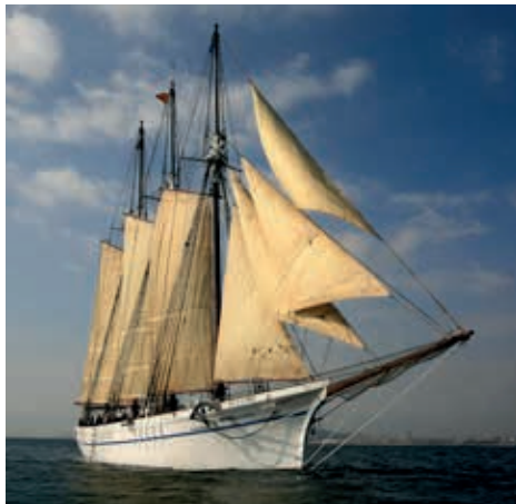
Pailebote Santa Eulàlia

El Museo Marítimo de Barcelona (MMB) nació el año 1936 y es una institución pública dedicada a la divulgación de la cultura marítima y, en especial, a la conservación, preservación y difusión del patrimonio cultural marítimo de Cataluña. El MMB está muy vinculado a la ciudad de Barcelona, tanto por su propia historia como por el edificio que lo acoge: el conjunto monumental de las Reales Atarazanas de Barcelona.