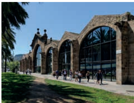
Fachada de las Reales Atarazanas

Es un velero de más de cien años que forma parte del patrimonio en el agua del Museo. Permite comprender la historia de la navegación y el comercio marítimo en nuestro país. Por su valor patrimonial e histórico, en el 2011 fue declarado Bien Cultural de Interés Nacional. El Santa Eulàlia está amarrado en el Muelle de Bosch i Alsina, muy cerca del Museo Marítimo. Se puede visitar diariamente. Los sábados por la mañana sale a navegar por el frente marítimo de Barcelona, excepto cuando participa en eventos náuticos tradicionales.