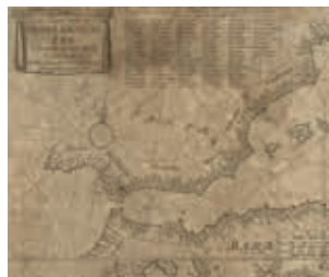
Cartografía de Pieter Goos (Amsterdam, 1673).