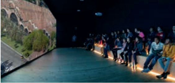
Audiovisual sobre la historia del edificio de las Reales Atarazanas.

Exposición en torno a la historia del conjunto monumental de las Reales Atarazanas de Barcelona, edificio construido al servicio de la industria naval catalana para favorecer la expansión por el Mediterráneo durante los siglos XIII-XV. Un recorrido a través del edificio, los oficios tradicionales y las galeras, y en especial, la réplica de la Galera Real.