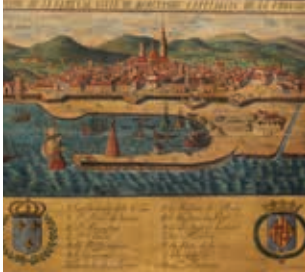
Barcelona antes del desarrollo del comercio con América (siglo XVII).

Exposición que relata la evolución de la navegación marítima catalana, del comercio por el Mediterráneo al comercio transatlántico, así como el paso de la vela al vapor. Tres siglos en los que la marina catalana se abre económicamente y socialmente a nuevos mundos.