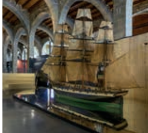
Fragata Barcelona . Modelo de enseñanza (Escuela de Náutica de Barcelona, siglo XIX).