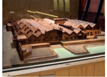
Maqueta de las Reales Atarazanas en 1880.