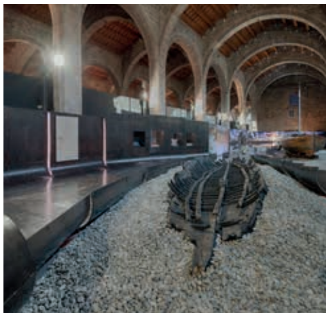
Recreació de l'entorn natural on es van localitzar les restes de Les Sorres X .

Les Sorres X és una petita embarcació de la segona meitat del segle XIV destinada al transport de mercaderies. És una de les poques barques medievals que es conserven a la Mediterrània. Per això és una oportunitat única per a l'estudi i la divulgació de la navegació de cabotatge de l'època.