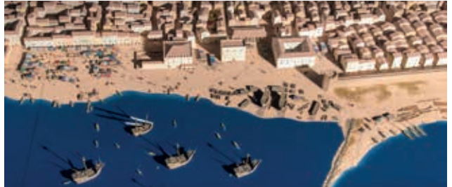
La façana marítima de Barcelona al segle XV.