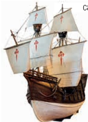
Model de la Nau Santa Maria de la Victoria (segle XVI). Va ser la primera en completar la volta al món.

Set històries narrades per set personatges a bord de set vaixells que expliquen qüestions universals com el descobriment de nous territoris, el mar com a espai de lleure, la vida a bord d'un transatlàntic, el mar com a escenari de conflictes, la mercaderia, la pirateria i el cors, i el canvi tecnològic. Un viatge per la història de la navegació moderna i contemporània.