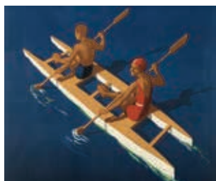
Detall del cartell publicitari Playas de Cataluña (Josep Morell, 1940).