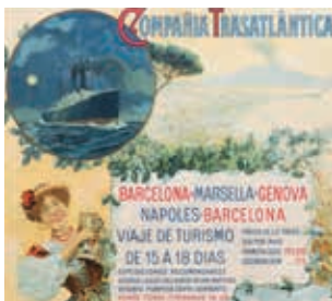
Cartell publicitari de la Compañía Trasatlántica (Ruiz, 1910).