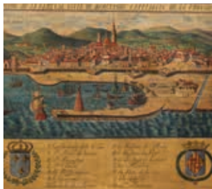
Barcelona abans del desenvolupament del comerç amb Amèrica (segle XVII).

Exposició que relata l'evolució de la navegació marítima catalana, des del comerç per la Mediterrània fins al comerç transatlàntic, així com el pas de la vela al vapor. Tres segles en els que la marina catalana s'obre econòmicament i socialment a nous mons.