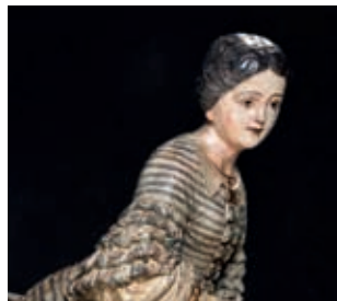
Mascaró de proa La Blanca Aurora (Lloret de Mar, 1848).