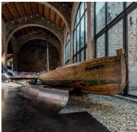
Barca de pesca Papet (segle XX), hereva de la tradició constructiva medieval.