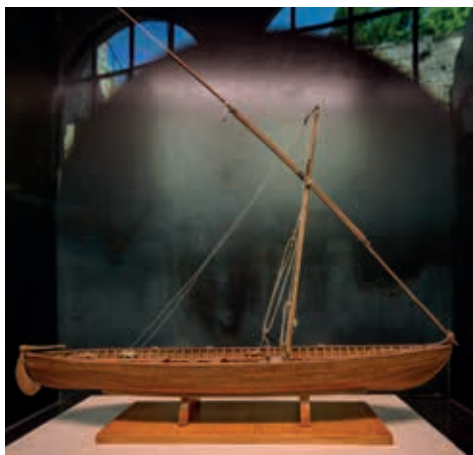
Reconstrucció hipotètica de la barca Les Sorres X a partir de les restes conservades.