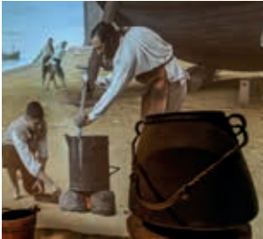
Els oficis tradicionals de mar.