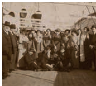
Retrat d'un grup de passatgers a la coberta d'un transatlàntic (1910).