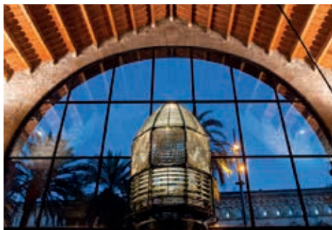
Òptica del Far de Sant Sebastià

El conjunt monumental de les Drassanes Reials de Barcelona té més de set segles d'història. Va ser construït al segle XIII per a la fabricació i manteniment de galeres i vaixells de guerra al servei del rei d'Aragó Pere el Gran. És un dels edificis del gòtic civil més importants del món.