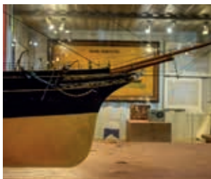
Model del vapor City of Paris (1888). Un exemple de la transició de la vela al vapor i de la fusta a l'acer.