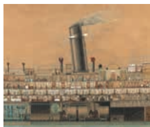
Dibuix longitudinal del Reina Victòria Eugènia . Cia Transatlàntica Española (1912).