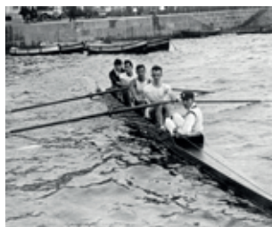
Outrigger a 4. Campionat d'Espanya (Barcelona, cap al 1924).