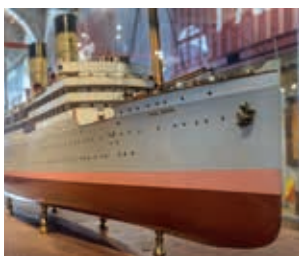
Model del vapor Royal Edward (Glasgow, 1907).