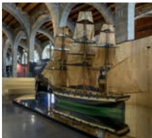
Fragata Barcelona . Model d'ensenyament (Escola de Nàutica de Barcelona, segle XIX).